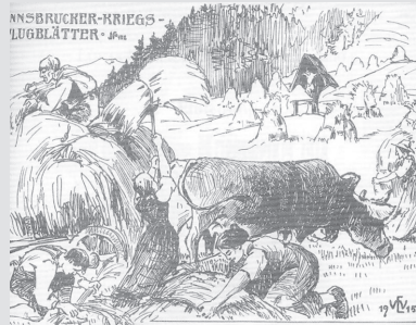
Am Land übernehmen Frauen die Arbeiten der Männer (Innsbrucker Kriegsflugblätter 1915, Cod-270 StA Innsbruck)

ten Frauen nun Entscheidungen allein treffen: wann mit der Aussaat oder der Ernte beginnen, welches Vieh wann wem zu welchem Preis verkaufen. Wenn wir uns diese Mehrfachbelastungen, die täglich und jahreszeitlich notwendigen Arbeiten in Haus und Hof und die dazu fälligen Entscheidungen, sowie die Obsorge von kleinen Kindern und alten Menschen, vor Augen halten, dann haben wir sicher rasch das Bild vom Burn-Out-Syndrom bei der Hand. Aber nach der damaligen Mentalität musste jede Frau mit Schwierigkeiten des Lebens selbst fertig werden. Verständnissvolle Seelsorger waren vielleicht die einzigen, an die sie sich wenden konnte. Bereits ab Frühjahr 1915 wurden Kriegsgefangene als Hilfskräfte in der Landwirtschaft eingesetzt. Durch die gemeinsame Arbeit wurde aus dem gefangenen Feind ein Mitmensch, oft in der Hoffnung, dass die eigenen männlichen Angehörigen es auch gut treffen würden. Es kam auch zu sexuellen Bezie-