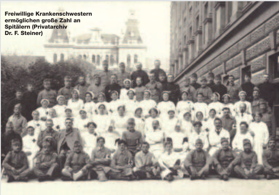
Freiwillige Krankenschwestern ermöglichen große Zahl an Spitälern

kurzem Entscheidungen über den Transport von Hausrat treffen mussten. Das Militär war bei der „Verbringung“ der Italiener ins Hinterland nicht zimperlich und trug dabei längerfristig zum Abbau der Loyalität dieser Frauen gegenüber „Österreich“ bei, deren Männer noch für dieses Österreich in Galizien kämpften. Heute ist klar, dass Front und Hinterland miteinander verbunden und nicht getrennt waren in Frauenräume (Hinterland) und Männeräume (Front). Symbol dieser