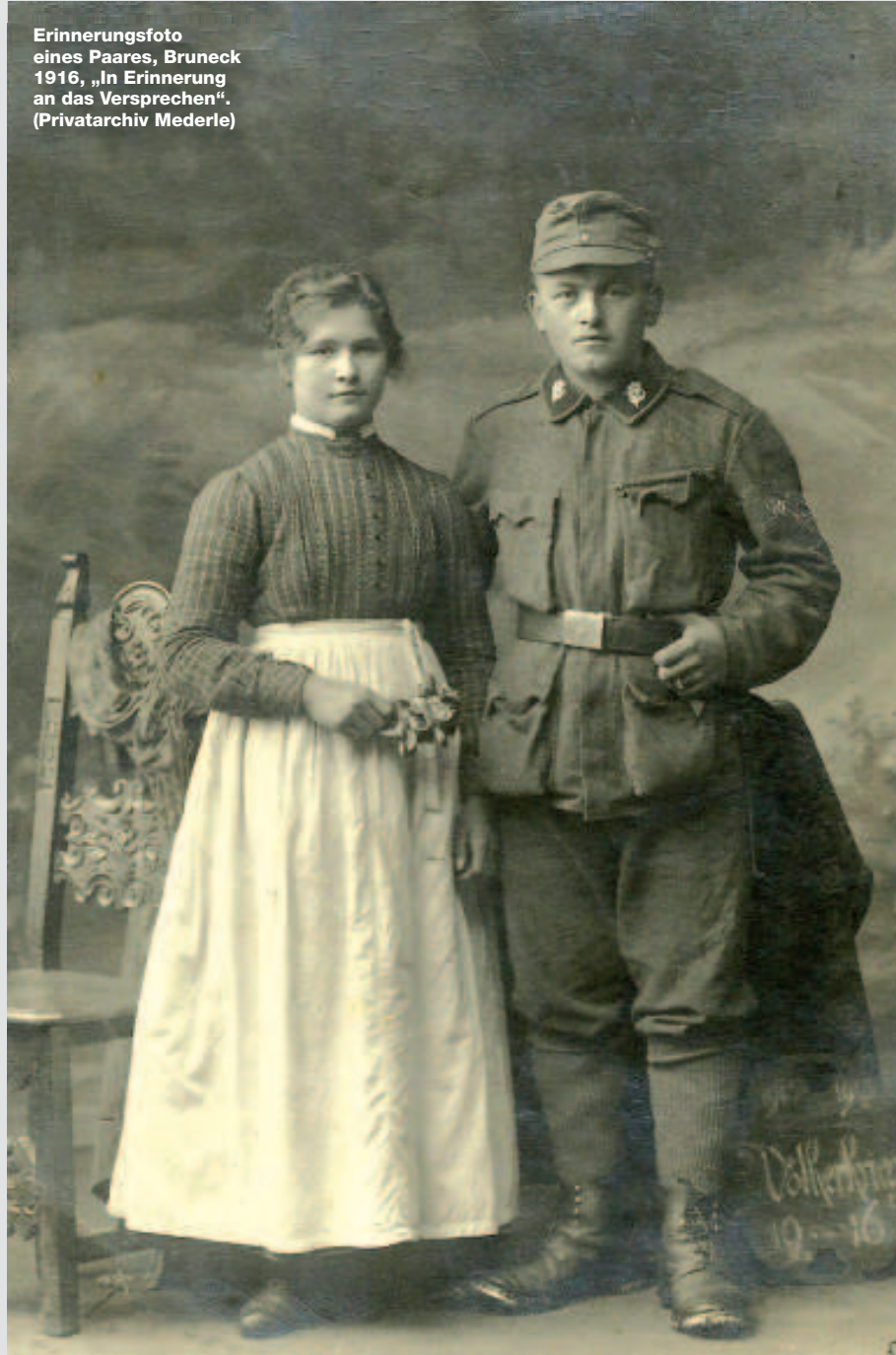
Erinnerungsfoto eines Paares, Bruneck 1916, „In Erinnerung an das Versprechen“.

gehörige mithalfen, ist schwer zu beziffern. Frauen, die kleine Kinder oder ältere Angehörige zu versorgen hatten, suchten mit Heimarbeit ihre Einkommenssituation zu verbessern. Schätzungsweise lag ihre Zahl in Tirol gleich hoch wie jene der in Fabriken arbeitenden Frauen. Die meisten Frauen im Kronland Tirol (rd. 256.000) arbeiteten in der Landwirtschaft. Als im Sommer 1914 etwa ein Drittel der in der Tiroler Landwirtschaft beschäftigten Männer eingezogen wurde, hatte das erhebliche Auswirkungen auf die traditionelle Arbeitsteilung zwi-