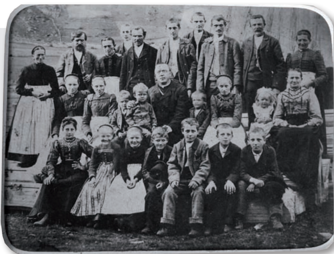
Die Großfamilie Haller